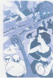
Le samedi 17 juin Guinche à la gare d'eau