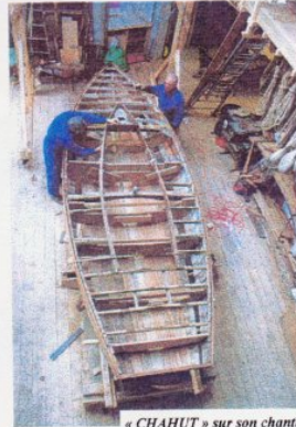
« CHAHUT » sur son chantier

Une seule ombre au tableau... la qualité des tire-bouchons ! Ils s'auto-détruisent en mutilant l'opérateur lors de sa précieuse mission. Il nous faut des tire-bouchons, des vrais ! et non pas ces machins venus des pays lointains où l'on ignore tout du jus de la treille. Heureusement il y a du jus d'orange qui, lui, ne demande pas de tire-bouchon pour s'ouvrir !