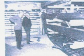
Déjà plus une place de libre !