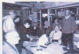
avant guerre l'Association des propriétaires d'« Hironnelles ».