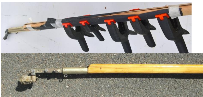
Les voiles actuelles viennent du Zef

Surprise: La bôme est trop courte de 7cm ! On la rallonge par une ferrure intermédiaire du côté du vis de mulet