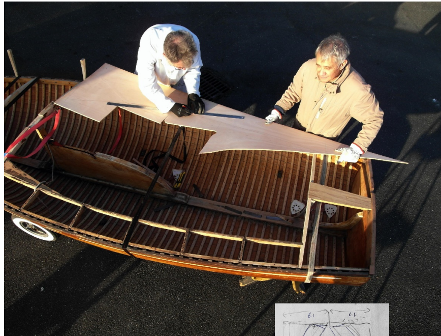
Optimisation du CTP marine pour le dessous de pont