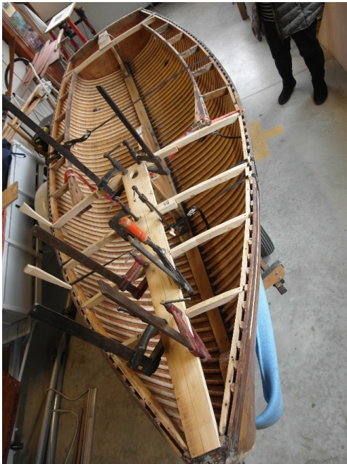
Réfection des épontilles