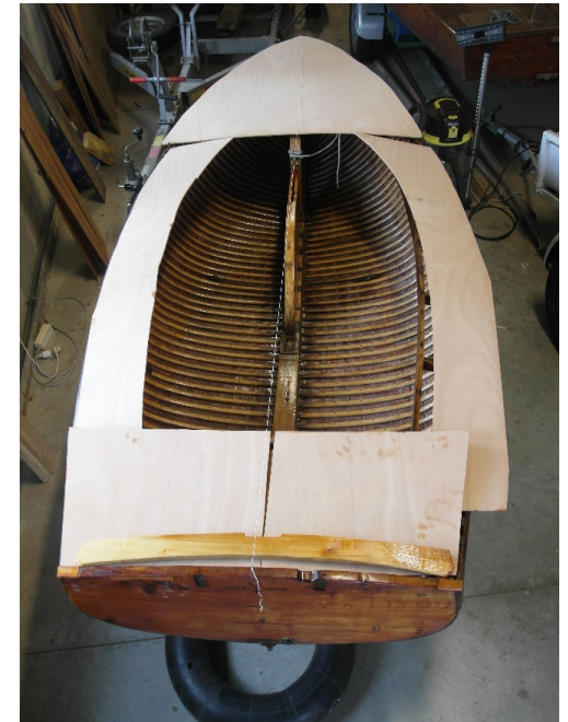
Assemblage du sous- pont