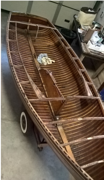
Déshabillage du pont